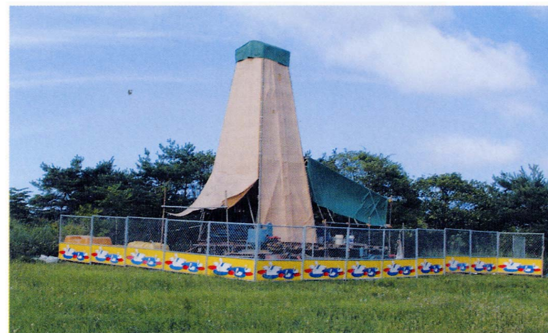
ボーリング調査(イメージ)