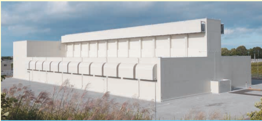
完成した貯蔵建屋(国の使用前検査終了)

本年10月の事業開始を目指してまいりましたが、12月に施行される予定の新規制基準への適合性の確認が必要なため、その申請に向けての準備を進めるとともに、新たな事業開始時期の検討を行っております。