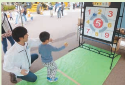
ストラックアウトで遊んでいただきました