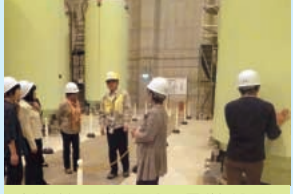
東海第二発電所の見学(9月)