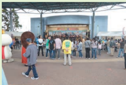
イベント会場では色々な催しが行なわれました