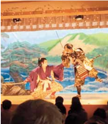
平敦盛役の中村さん (向かって左側)