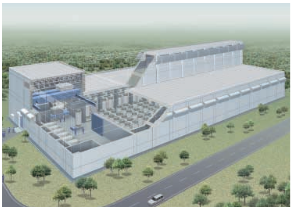
リサイクル燃料備蓄センター イメージ図

工事の開始*平成21年4月(予定) *「工事の開始」とは貯蔵建屋基礎工事の開始を示す。 操業開始 平成22年12月(予定)