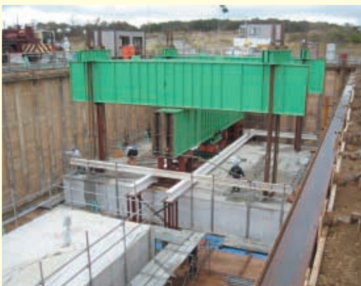
杭の載荷試験の様子