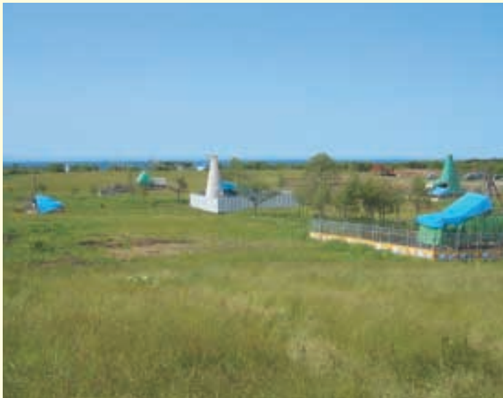
ボーリング調査の様子

事業の推進にあたりましては、安全確保を第一に、情報公開や品質保証体制の確立に努めるとともに、地元と一体となって、地域の発展に取り組んでまいります。